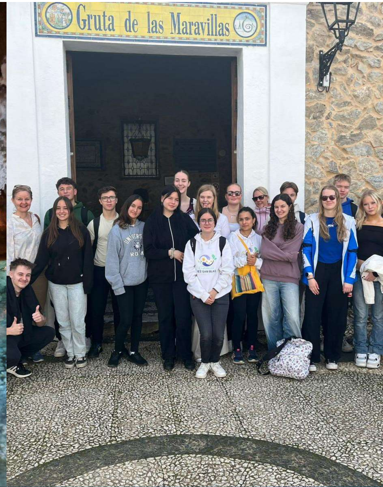
Tippukiviluola Gruta de las Maravillas ja linna Castillo de Aracena.