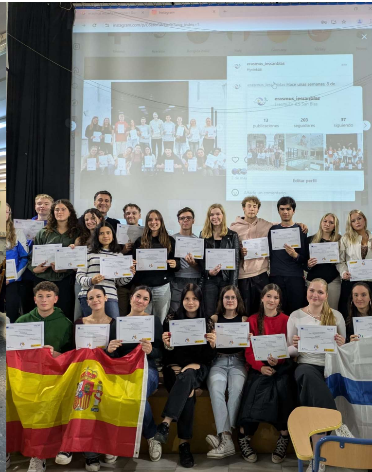
Todistukset ja läksiäisjuhla