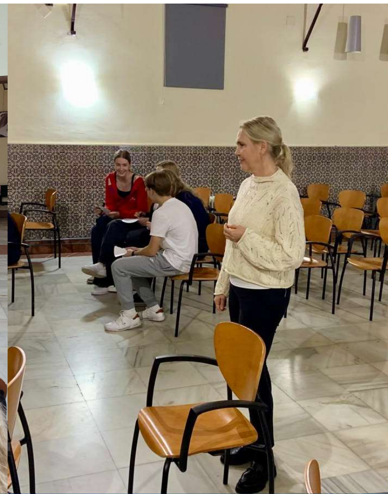
Hyvinvointiin liittyviä harjoituksia koulussa