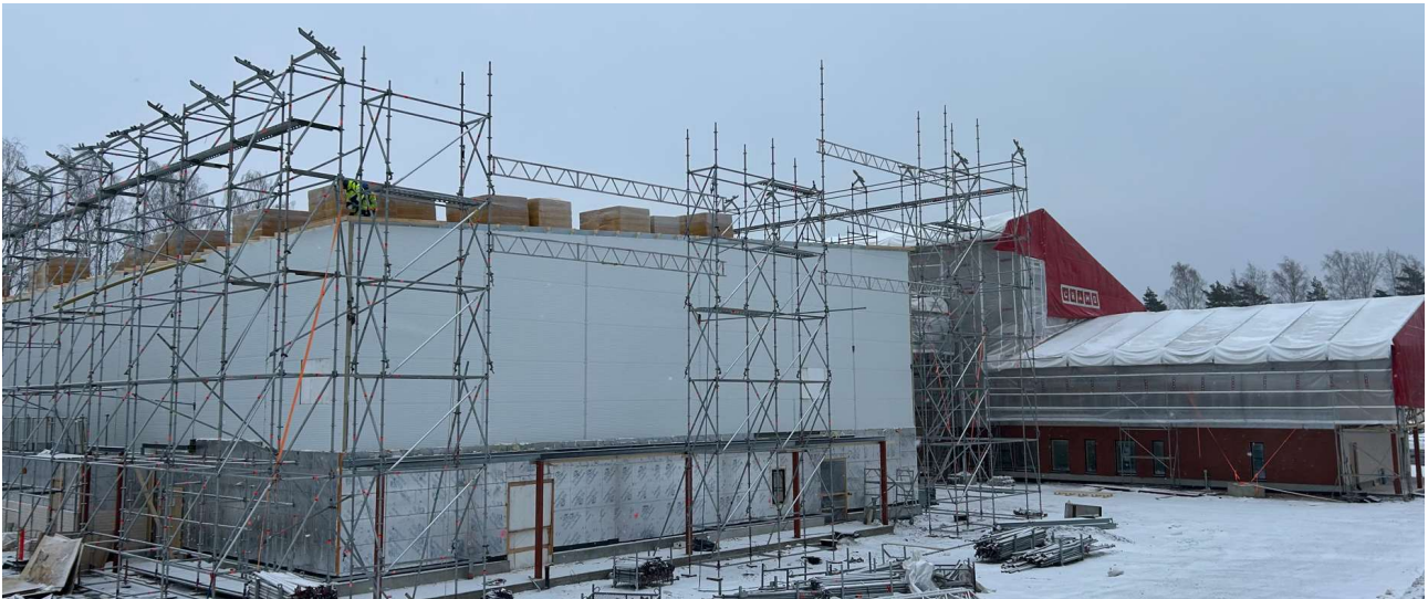
Sääsuojan asennus liikuntahallin päälle on käynnissä

Liikuntahallin katon sääsuojan asennus on käynnissä. Rakennuksen sisällä liikuntahallin lattia betonivalut ovat alkamassa. Päiväkodin puolella ovat väliseinät pitkällä. Seinien laatoitus, tasoitus- ja maalaustyöt ovat käynnissä.