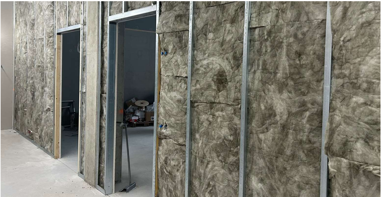
Väliseinätyöt ovat käynnissä