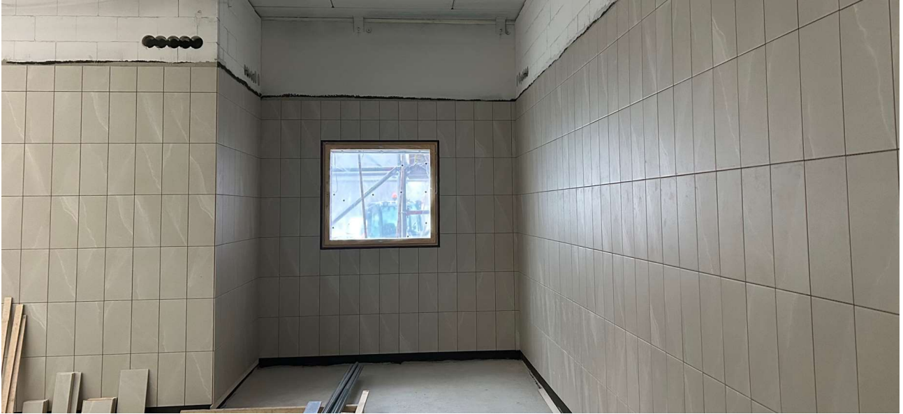
Laatoitustyöt ovat käynnissä