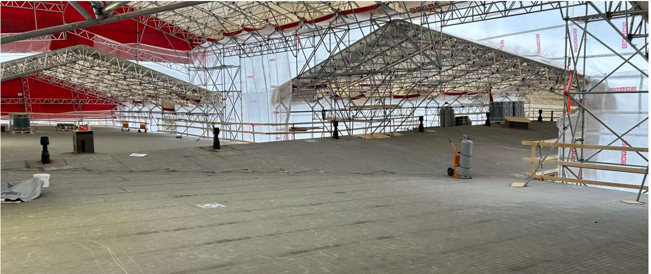
Pintahuovan asennus päiväkodin katolla on käynnissä