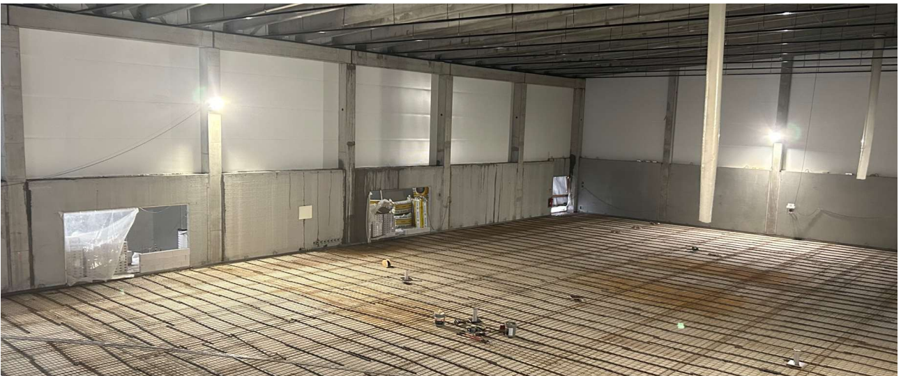
Liikuntasalin lattiavalut ovat alkamassa