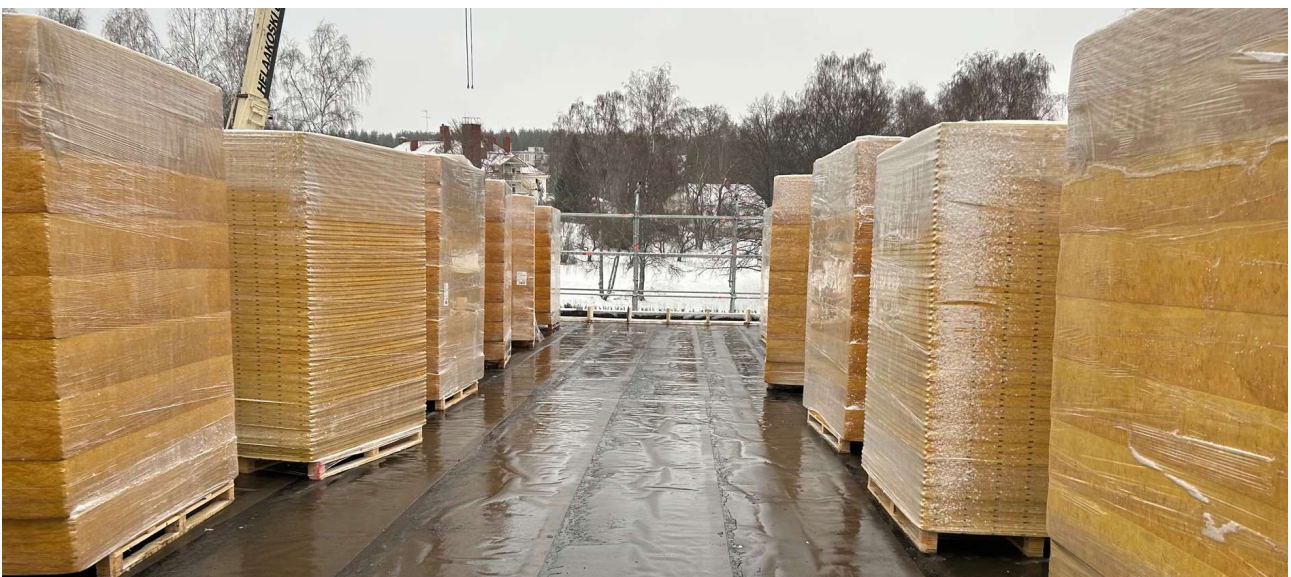
Lämmöneristeiden asennus liikuntahallin katolla alkaa, kun sääsuoja on asennettu