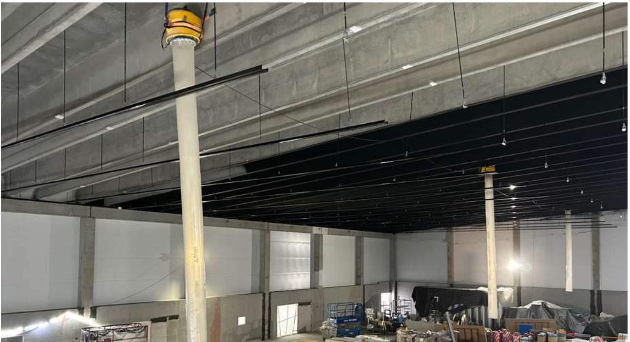
Liikuntasalin katon maalaus on käynnissä