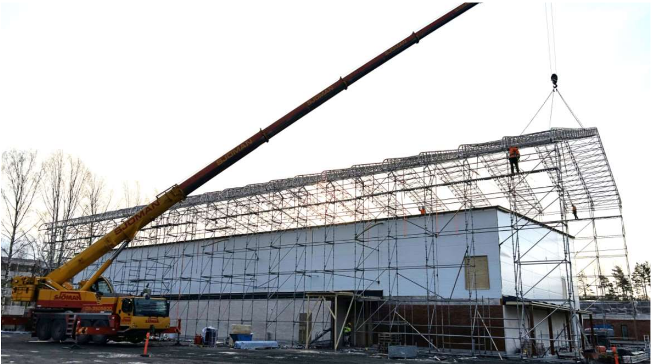
Sääsuojan purku on aloitettu

Paavolatalon vesikatto on vedenpitävä ja turhaksi jääneen sääsuojan purku on aloitettu. Rakennuksen sisällä liikuntahallin katon maalaus on käynnissä. Päiväkodin puolella on alakattoasennukset aloitettu. 2 kerroksessa väliseinämuuraus on käynnissä.