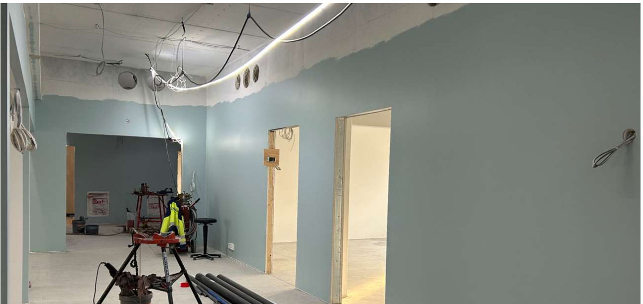
Väliseinät on pintamaalattu