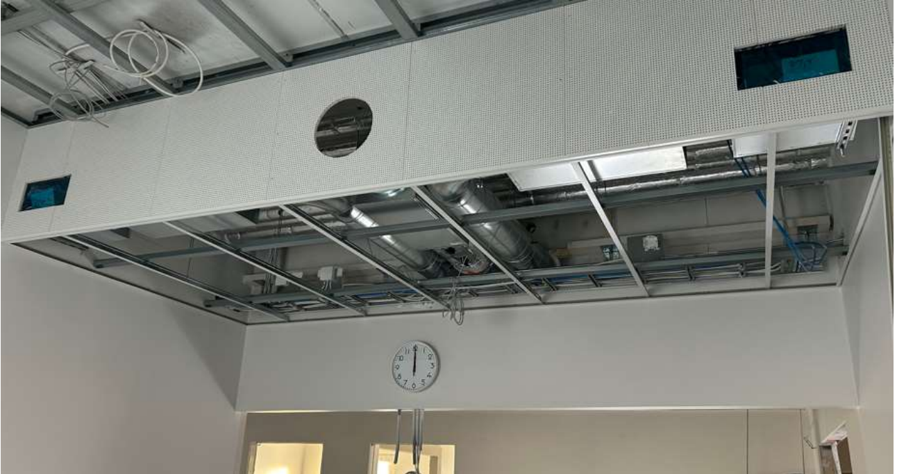
Päiväkodin alakattorunkojen asennus on aloitettu