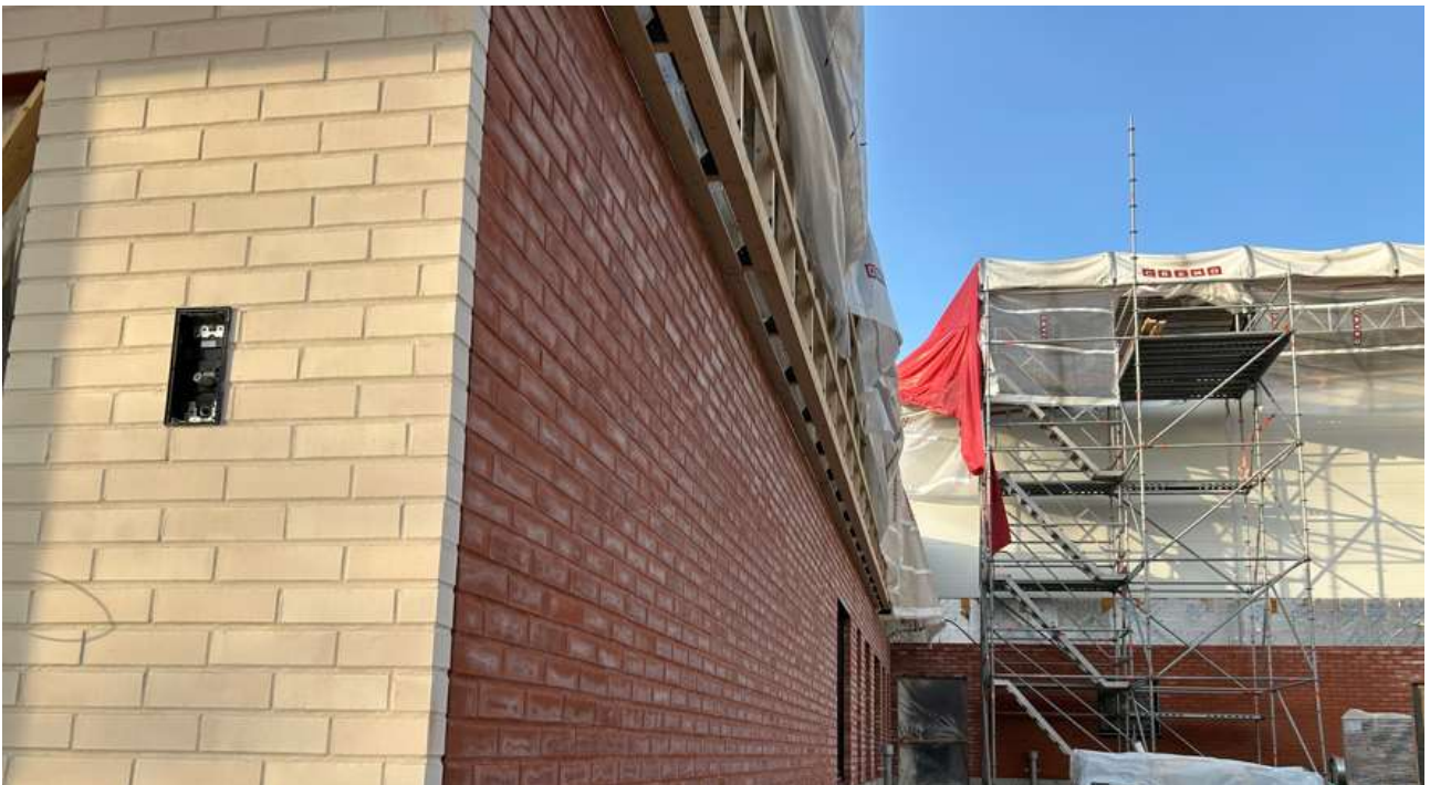
Julkisivumuuraus on valmis