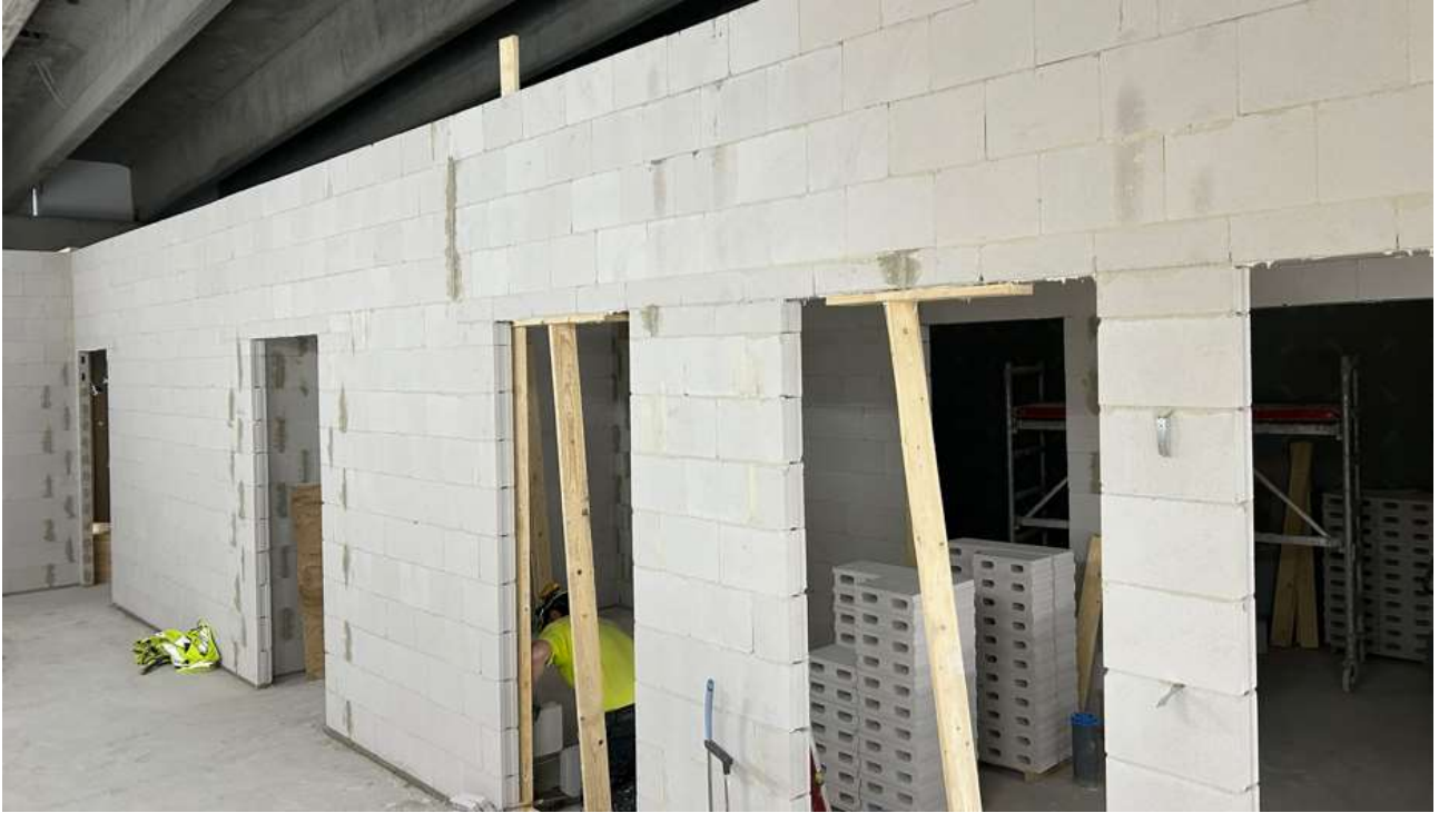
2 kerroksen väliseinien muuraus on käynnissä