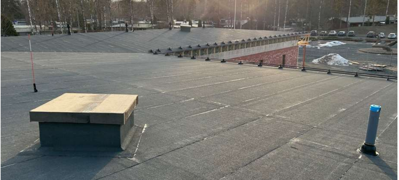
Vesikatto on koko rakennuksen osalta vedenpitävä