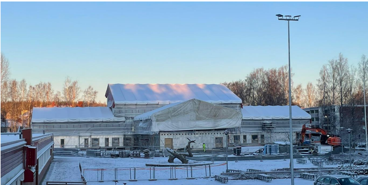
Yleiskuva Paavolatalosta koulun suunnasta katsottuna

Paavolatalon työmaan työt etenevät aikataulussa. Vaikka rakennusaikataulu onkin tiukka myös rakentajat hiljentyvät joulun viettoon, vaikka kokonaan emme työmaata jouluviikoksi laita kiinni.