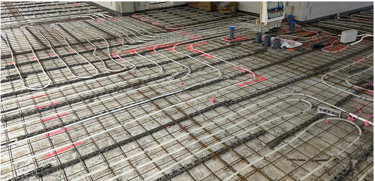
Lattietyöt ovat käynnissä