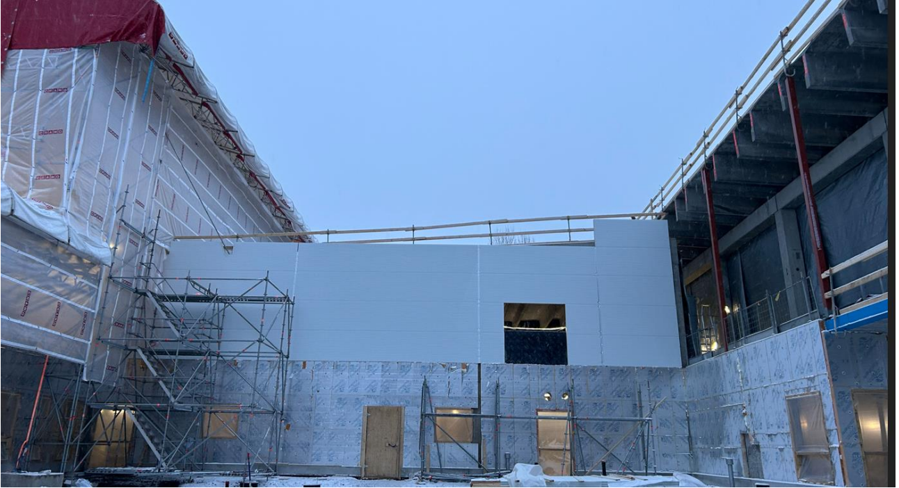
PVP- elementiasennukset on aloitettu