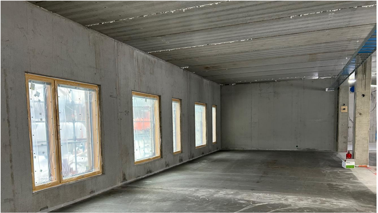
Ikkuna-asennus on käynnissä