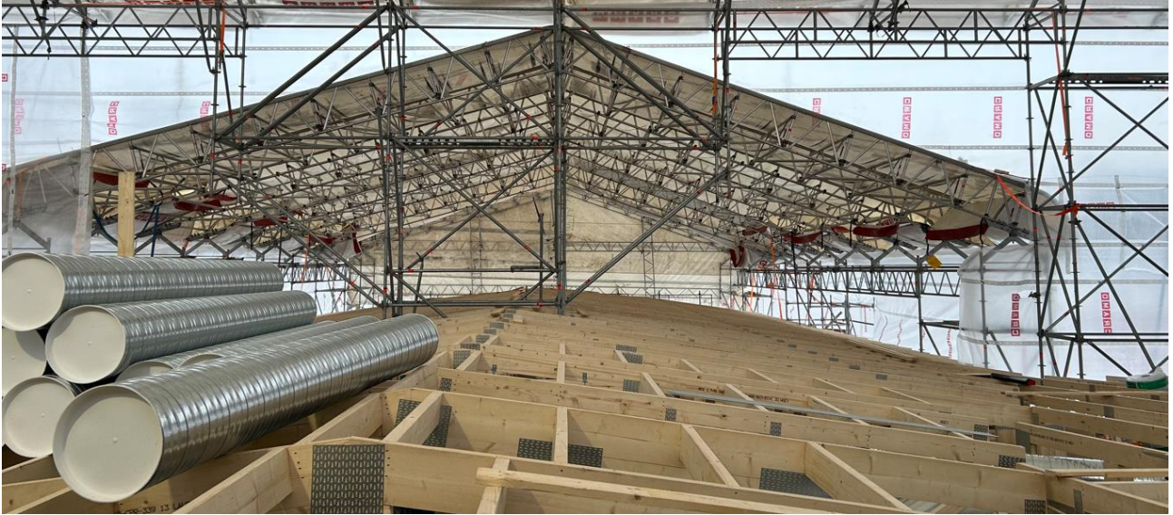
Vesikattotyöt ovat käynnissä sääsuojan alla