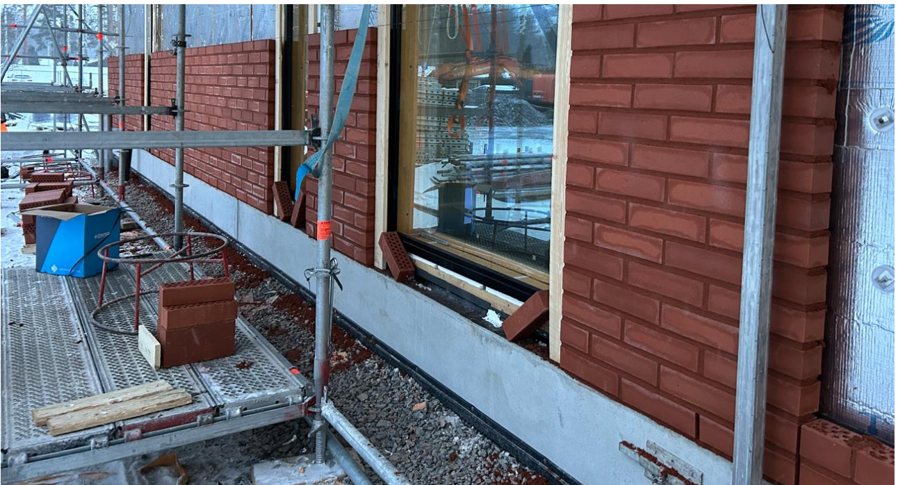
Julkisivun muuraustyöt on aloitettu